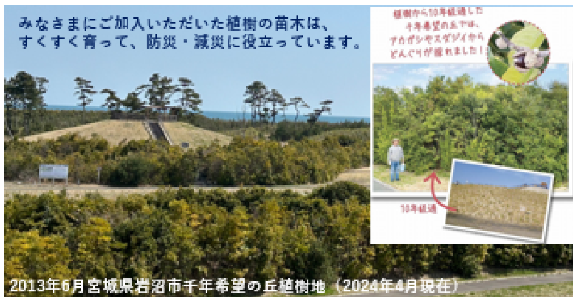
2013年6月宮城県岩沼市千年希望の丘植樹地（2024年4月現在）

みなさまにご加入いただいた植樹の苗木は、すくすく育って、防災・減災に役立っています。